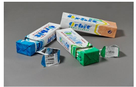
Abb: Sophie Schmidt, Kaugummi (Orbit), 2006, 15,4 x 76,5 x 23 cm, Kunstsammlungen Chemnitz/PUNCTUM/Bertram Kober

Weitere Bezüge in den Lehrplänen sind grundsätzlich möglich.